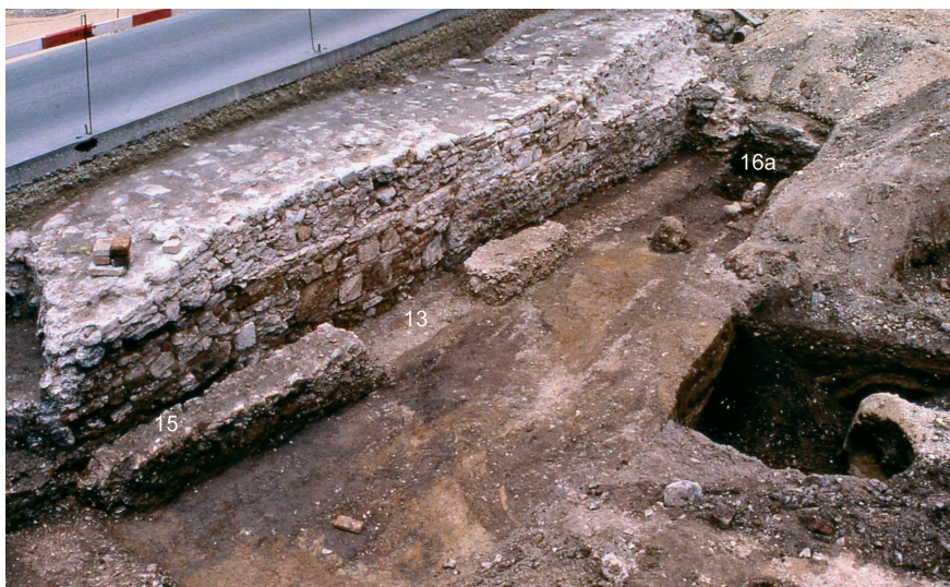
Abb. 2: Gesamtansicht der mittelalterlichen (?) Mauer 15 – über der römischen Mauer 13, parallel dazu die „Paradeisgartelmauer“ – mit der Verbindungsmauer 16a, Blick von Nordwesten.

Grube 326, die auf Grund moderner Störungen nur in ihrem untersten Bereich erhalten geblieben war, weist einen deutlich größeren Durchmesser, nämlich bis zu 2,80 m, auf. Auch hier datiert das Fundmaterial aus der Verfüllung vom späteren 14. bis in die Mitte des 15. Jahrhunderts.