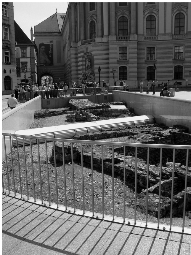
Abb. 1: Michaelerplatz – die heute sichtbaren, konservierten Mauerreste der Ausgrabungen.

Einen konkreten Hinweis auf Erdbebewegungen im Spätmittelalter, die das Niveau deutlich verändert haben könnten, stellen die Grube 288, ihre Verfüllung und die durch Fundmaterial identifizierbare Planierschicht dar-