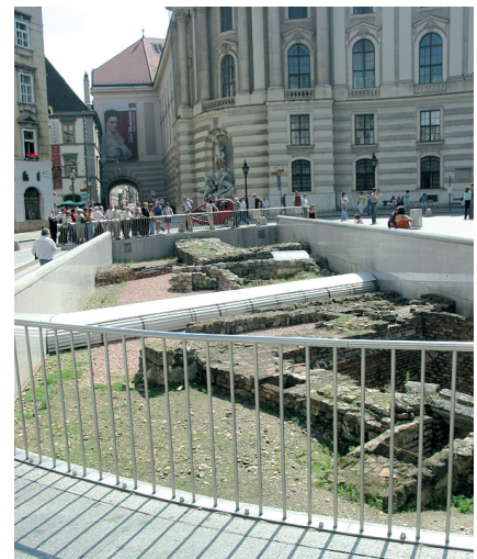
Fundort Wien 1/1998. Berichte zur Archäologie „Grabungsfeld“ Michaelerplatz 2007