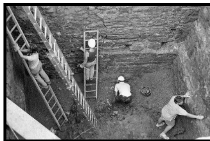
Oben: Aspangbahnhof – die Sonne brennt herab. Unten: Im Augustinerturm.