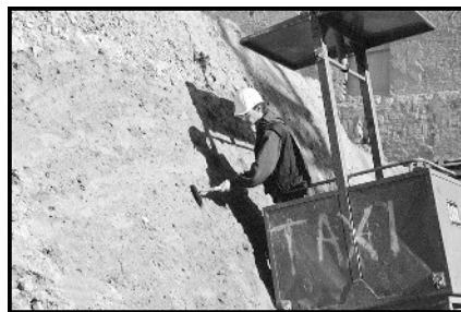
Oben: Händisches Abtiefen einer Grabungsfläche. Unten: Mit dem Kran in den mittelalterlichen Stadtgraben.