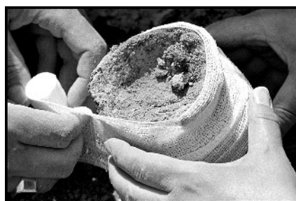
Links: Behutsames Freilegen einer Bestattung. Oben: Freilegen des Augustiner-Turms – der letzte Rest der Babenberger Stadtmauer. Unten: Stabilisieren eines schlecht erhaltenen awarischen Topfes – Bergung aus einem Grab.