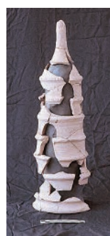
Abb. 1: Albertina – Mittelalterlicher „Augustinerturm“ und Stadtgraben. (Foto: R. L. Huber) Abb. 2: Unterlaa – römisches Lichthäuschen / Räuchergerät Nr. 1. (Foto: R. L. Huber) Abb. 3: Albertina – Führung durch das Grabungsgelände. (Foto: R. L. Huber)