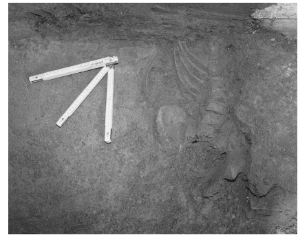
Abb. 2: Skelettrest in situ.

Gauß-Krüger-Koordinaten M 34: x = 3.448,2; y = 342.404,8.