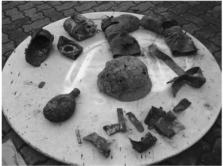
Abb. 2: Ausrüstung des Wehrmachtssoldaten.

Zentralfriedhof gebracht. Dort konnte der herangezogene Umbetter eine grobe Auflistung vornehmen. Da keine Erkennungsmarke gefunden wurde, war es nicht möglich, die Identität des Soldaten festzustellen. Teile der Stoffuniform bzw. Textilien waren schon am Fundort nicht aufgefunden worden. Ein Protokoll und eine Umbettungskladde wurden zum Volksbund Deutscher Kriegsgräberfürsorge e. V. nach Kassel (Deutschland) geschickt. Diesem Schreiben ist zu entnehmen, dass eine Gasmaske, ein Stahlhelm, Marschstiefel, Kochgeschirr und ein Koppel-Schloss (Wehrmacht) geborgen wurden (Abb. 2 und 3). Der medizinische Befund beschreibt u. a. den Zahnstatus. Einige Zähne wurden schon zu Lebzeiten gezogen. Nach den Knochenmaßen (Oberschenkel: 45,5 cm, Elle: 26,5 cm, Schienbein: 36,5 cm: ergibt eine Körpergröße von etwa 1,69/1,68 m), der Abnutzung der Zähne, den Schädelnähten und der Epiphyse wurde das ungefähre Alter auf 30–40 Jahre geschätzt. Die Schädeldecke zeigt Bruchstellen und Beschädigungen auf. 3