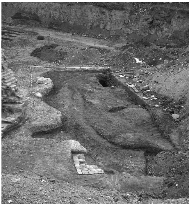
Abb. 4: Überreste der Kapelle des Spanischen Friedhofs, Blick nach Osten.

Im Südwesten des Grabungsbereiches erkannte man die Ausrisse eines Bauwerks. Die wenigen erhaltenen Ziegel in Originallage sowie der benutzte Mörtel indizieren eine Datierung ins 18. Jahrhundert. Die den Gräbern entsprechende Orientierung des Baus sowie eine auf dem Plan von Joseph Daniel Huber dargestellte Kapelle lassen darauf schließen, dass es sich um die Friedhofskapelle gehandelt hat (Abb. 4). Das West-Ost orientierte, rechteckige Gebäude wies im Norden einen vorragenden Stützpfeiler in Form von Gussmauerwerk mit Ziegelschalung auf. Eine in der Nordost-Ecke angrenzende Ziegellage könnte auf Grund der seichten Fundamentierung eine Basis für ein Denkmal gewesen sein. Die Unterkante des Baus befindet sich auf rund 14,90 m über Wr. Null. Östlich davon wurde ein weiterer auch nur als Ausriss erhaltener Befund dokumentiert, bei dem es sich um die Basis eines ebenfalls auf dem Plan von Joseph Daniel Huber dargestellten Kreuzes gehandelt haben kann.