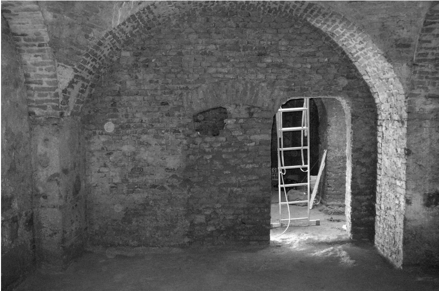
Abb. 2: Untergeschoß der Sakristei: Blick nach Süden.

Null im Nordosten, weisen somit ein West-Ost-Gefälle auf. Der ursprüngliche Gehorizont ist rund 1 m bis 1,50 m darüber zu rekonstruieren.