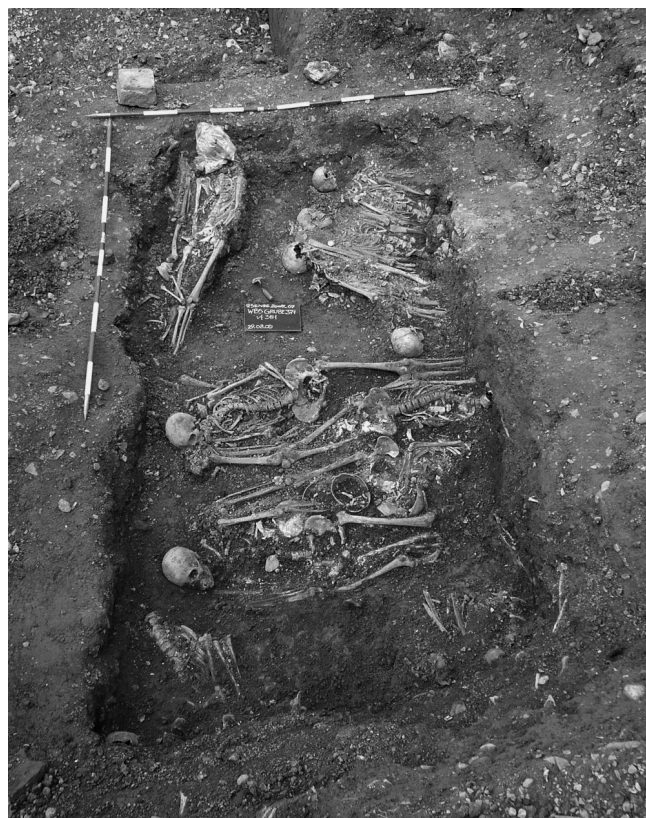
Abb. 3: Bäckenhäusl Friedhof: Skelettlage in einem Massengrab.

Anders als die bisher dokumentierten Schachtgräber für Sargbestattungen, manifestierten sich auf dem Gelände zumindest sechs Gruben für Massengräber. Sie waren einerseits durch die Fundamente des K.K. Offiziersspitals massiv gestört, andererseits aber auch durch dessen Abriss und Einplanung. Die zuletzt genannten Störungen zeigten sich durch stark durchwühlte Skelettlagen, aber auch durch ein massives Auftreten von Bauschutt in den oberen 1 bis 2 m der Gruben. Die Form der Massengräber war annähernd rechteckig mit abgerundeten Kanten. Die Ränder fielen beinahe vertikal ab, wobei sie im Bereich der Ober- und der Unterkanten abgeflacht waren, die Grubenböden waren eben. Die durchschnittlichen Ausmaße in der Fläche dürften rund 4 × 5 m betragen haben, die Tiefe ca. 4 m. Die Verfüllung bestand aus gelbgrauem Schotter, in dem die Skelettlagen eingebettet waren (Abb. 3). Wie sich anhand ihrer Lage erkennen ließ, waren die Verstorbenen in Stoffsäcken bestattet worden. Sie lagen alternierend und möglichst platz sparend neben- und übereinander. Drei bis vier Lagen von Skeletten bildeten je ein Paket, das mit rund 20 bis 30 cm Schotter überlagert war, ehe sich der Ablauf wiederholte. Auch in den Massengräbern konnte vereinzelt Chlorkalk dokumentiert werden, Funde sind hingegen kaum zu Tage getreten.