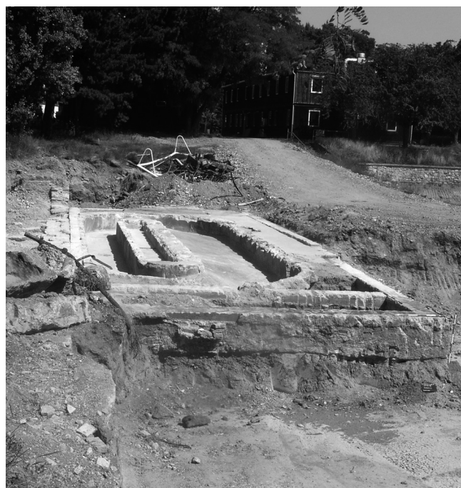
Abb. 5: Ruderbeckenanlage: Blick nach Osten.

Trotz zusätzlich durchgeführter Probeschnitte mit dem Bagger konnten am gesamten Gelände keine Befunde