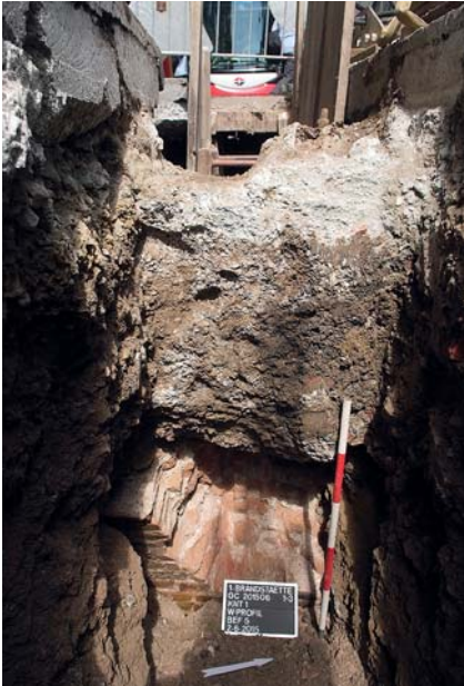
Abb. 2: Frühneuzeitliches Ziegelgewölbe Bef.-Nr. 5 des ehemaligen Fürst Liechtenstein'schen Hauses vor Brandstätte 1–3 mit Gewölbeansatz Richtung Südosten, Blickrichtung Nordwesten.