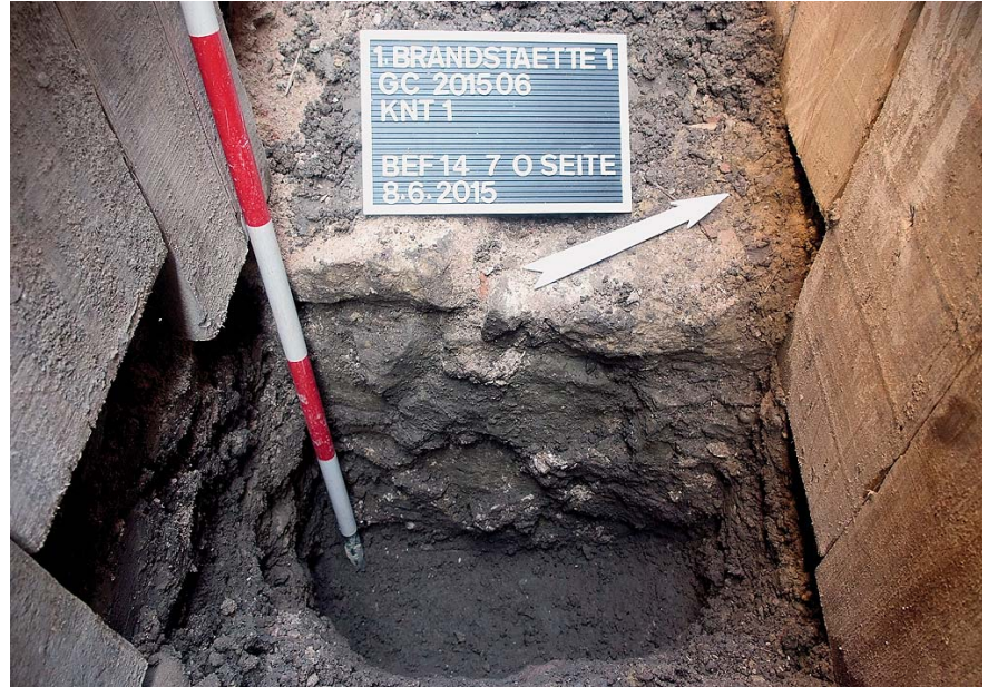
Abb. 3: Ostseite der Bruchsteinmauer Bef.-Nr. 7 vor dem Haus Brandstätte 1 als die vermutete Frontseite der Legionslagermauer bzw. der hochmittelalterlichen Stadtmauer. Davor die (Graben?)-Verfüllung Bef.-Nr. 14, Blickrichtung Nordwesten.

den, dürfte aber – wie die darüber gesetzte Ziegelmauer Bef.-Nr. 6 – mindestens 1,60 m betragen. Die Rekonstruktion der östlichen Legionslagermauer würde nahelegen, dass das Liechtenstein'sche Haus auf der Brandstatt unmittelbar auf die Lagermauer bzw. auf die an gleicher Stelle angenommene hochmittelalterliche Stadtmauer gesetzt wurde und Bef.-Nr. 7 damit entsprechend als römerzeitlicher bzw. mittelalterlicher Mauerabschnitt interpretiert werden kann. 7