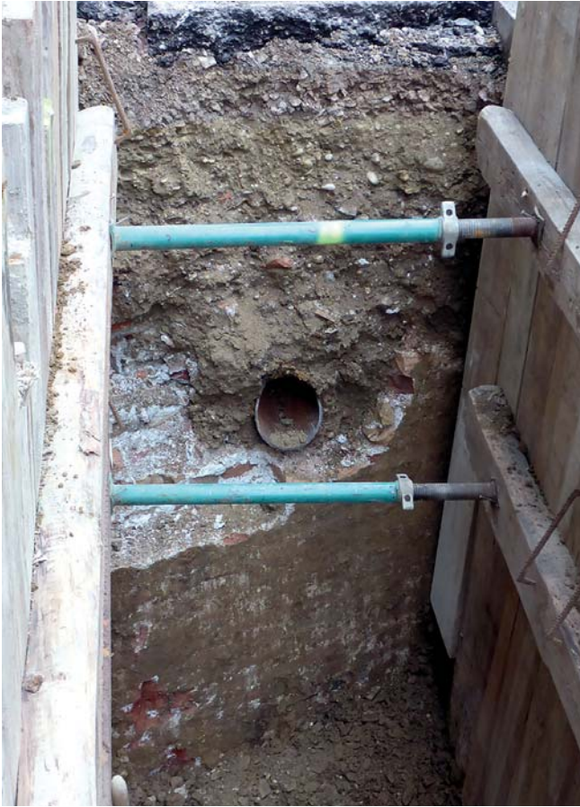
Abb. 2: Künette vor Hohenstaufengasse 12, Ziegelmauerwerk der Elendbastion, Blickrichtung Süden.