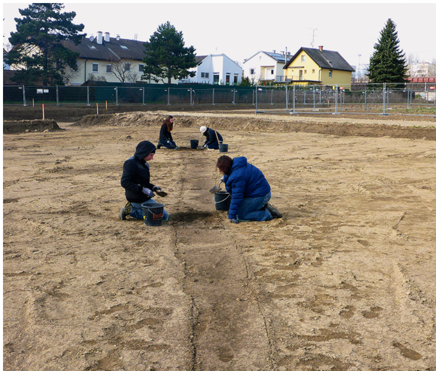
Abb. 2: Das vermutliche Drainage-Gräbchen Objekt 2 wird mittels zweier Sondagen untersucht, Blickrichtung NNW.