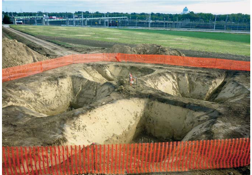
Abb. 2: Die Fundamentgruben des Strommasten M4, im Hintergrund die Kirche des Zentralfriedhofs.