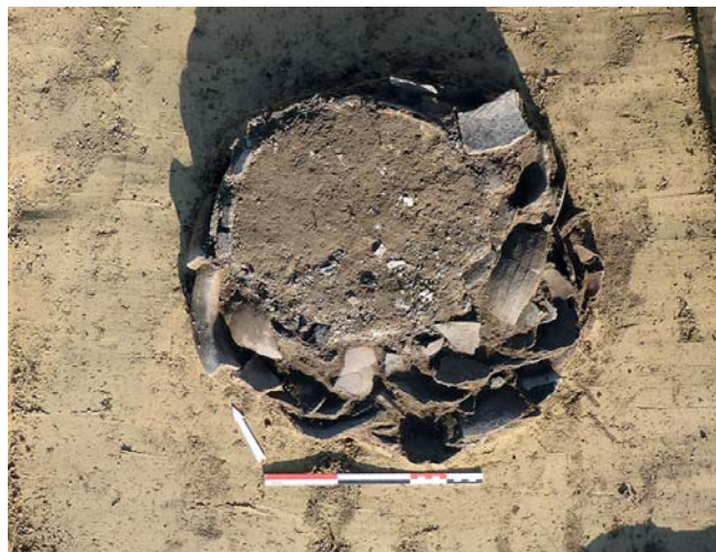
Abb. 2: Reste des spätbronzezeitlichen Urnengrabes Obj. 1.

Die aufgedeckten Flächen waren über weite Teile frei von archäologisch relevanten Funden und Befunden. Eine isoliert gelegene runde Grube (Obj. 3) im westlichen Teil des SPQ wurde nicht weiter ausgegraben, nachdem ihre moderne Zeitstellung festgestellt werden konnte. Im mittleren Bereich, wenige Meter nördlich der West-Ost gerichteten (kleineren) Rollbahn konnte im gelblich braunen Lösslehm ein Urnengrab erfasst werden (Obj. 1), das als einziger Rest eines kleinen spätbronzezeitlichen Brandgräberfeldes erhalten geblieben war, das am nordöstlichen Rand einer zeitgleichen Siedlung situiert war. 2 Unmittelbar 1,2 m westlich davon wurde ein fundleerer, rezent mit humosem Material verfüllter Grubenrest (Obj. 2) dokumentiert, der aufgrund seiner Form und Lage als ein alt ausgegrabenes Urnengrab interpretiert werden kann. Zur Rollbahn hin waren in der unmittelbaren Umgebung zahlreiche moderne Bodenstörungen zu vermerken, im nördlichen Anschluss zeigte sich nur befundfreier, steriler gelbbrauner Lösslehm. Die Flächen zwischen den Suchschnitten im nächsten Umkreis der Fundstelle wurden während des weitergehenden Oberbodenabtrages kontrolliert, allerdings ohne weitere archäologische Ergebnisse.